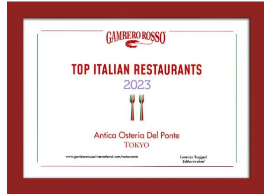
▲ ガンベロロッソより授与された賞状